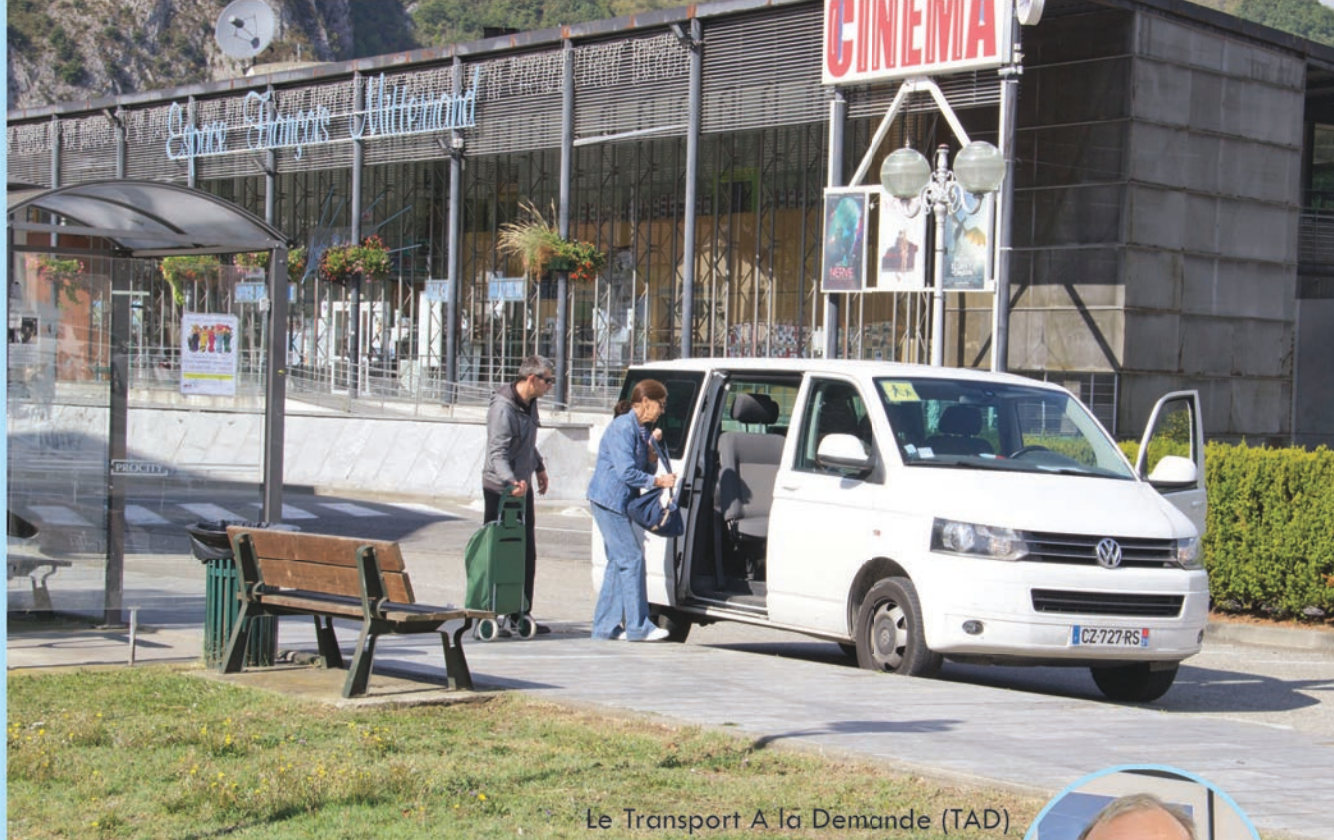
Le Transport A la Demande (TAD)