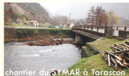
chantier du SYMAR à Tarascon

Le Syndicat Mixte d'Aménagement des Rivières (SYMAR) assure l'entretien des cours d'eau pour limiter les risques de crues de l'Hospitalet à Foix. En 2015-2016, les travaux sur le Tarasconnais ont concerné les cours d'eau suivant : l'Ariège d'Ornolac à la confluence avec l'Arnave, le Serbel à Mercus, et le ruisseau de Miglos.