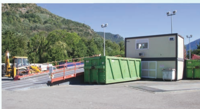
déchetterie provisoire d'Arignac

Cette installation permettra de réaliser une zone de dépôt plus sécurisée mais aussi la mise en place d'un espace dédié au dépôt et traitement de déchets vert et d'un espace adapté aux salariés qui prendront alors leur service sur ce nouveau site. Un quai de transfert permettra également d'inscrire cet équipement dans une logique de développement durable et d'économie. Ainsi le nombre de trajets entre notre territoire et le site d'enfouissement départemental sera fortement diminué en raison de la possibilité d'utiliser des véhicules au tonnage plus important.