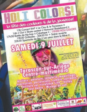
photo : « Holi Colors » - Fête de la Jeunesse 07/2016 à Tarascon-sur-Ariège - MJC Tarascon & LEC Grand Sud