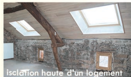
isolation haute d'un logement