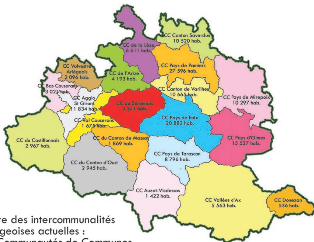
Carte des intercommunalités ariégeoises actuelles : 20 Communautés de Communes