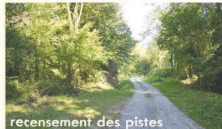
recensement des pistes

La Communauté de Communes a déposé une candidature auprès de la Région pour réaliser un Schéma de desserte Forestière sur son territoire. Il s'agit d'étudier les voiries mobilisables pour le transport des bois à l'aval des massifs forestiers mais aussi les dessertes internes des massifs. Ceci pour établir un état des lieux, et en chiffrer les aménagements. Le prestataire chargé de cette étude sera choisi prochainement, une fois les financements obtenus auprès du FEADER (Europe) et de l'Etat.