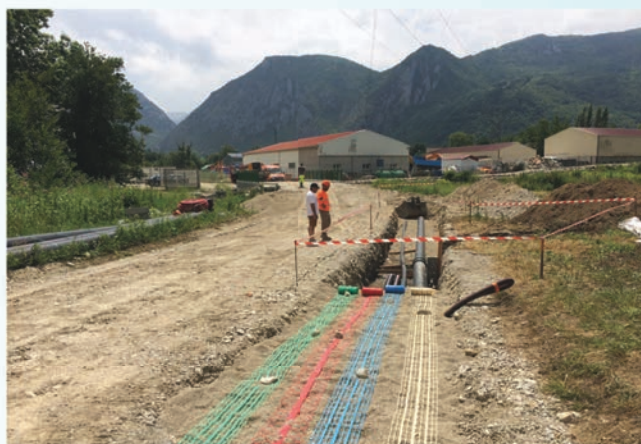
accès et réseaux pour la Zone de SAOU