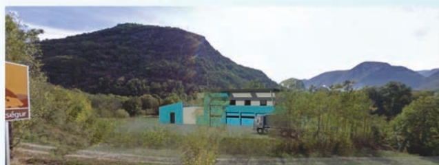
projections de la future STEP