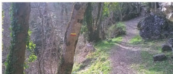
Sentier de la Roche Ronde (Bèdeilhac-Aynat)

L'offre de randonnée est en effet une composante essentielle de la destination touristique Tarasconnaise. Chaque année, la Communauté de Communes y consacre un budget de près de 50 000 €. Les randonnées sont recensées dans 4 topo-guides disponibles à la vente à l'Office de Tourisme au tarif de 6,60 €.