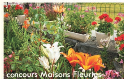
concours Maisons Fleuries